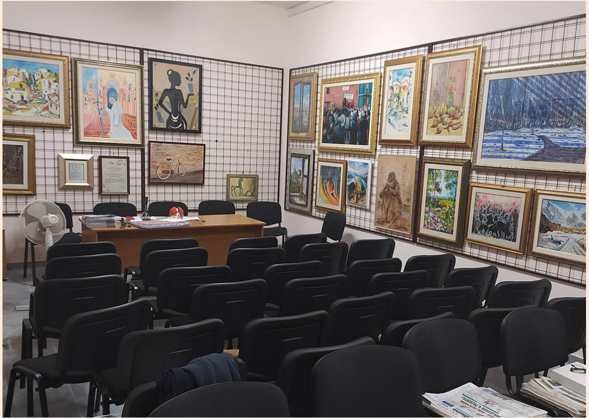
Sala riunioni redazione